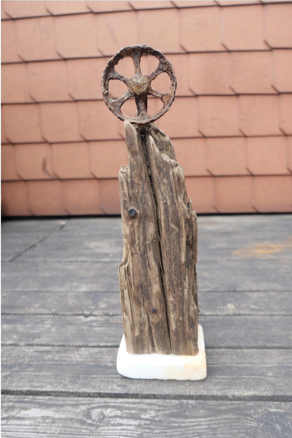
Martin Kesting „Sara-la-Kâli“ 2023 Iron, driftwood, marble 40 cm x 11 cm x 11 cm