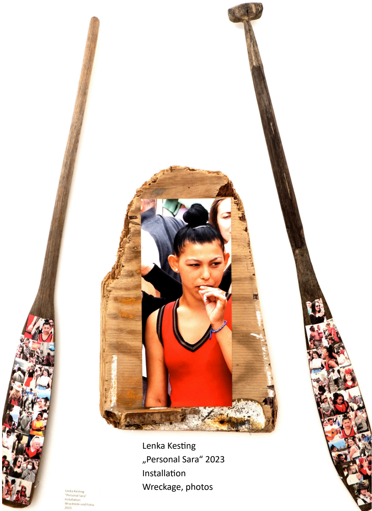
Lenka Kesting „Personal Sara“ 2023 Installation Wreckage, photos

Lenka Kesting "Personal Sara" Installation Wreckteile und Fotos 2023