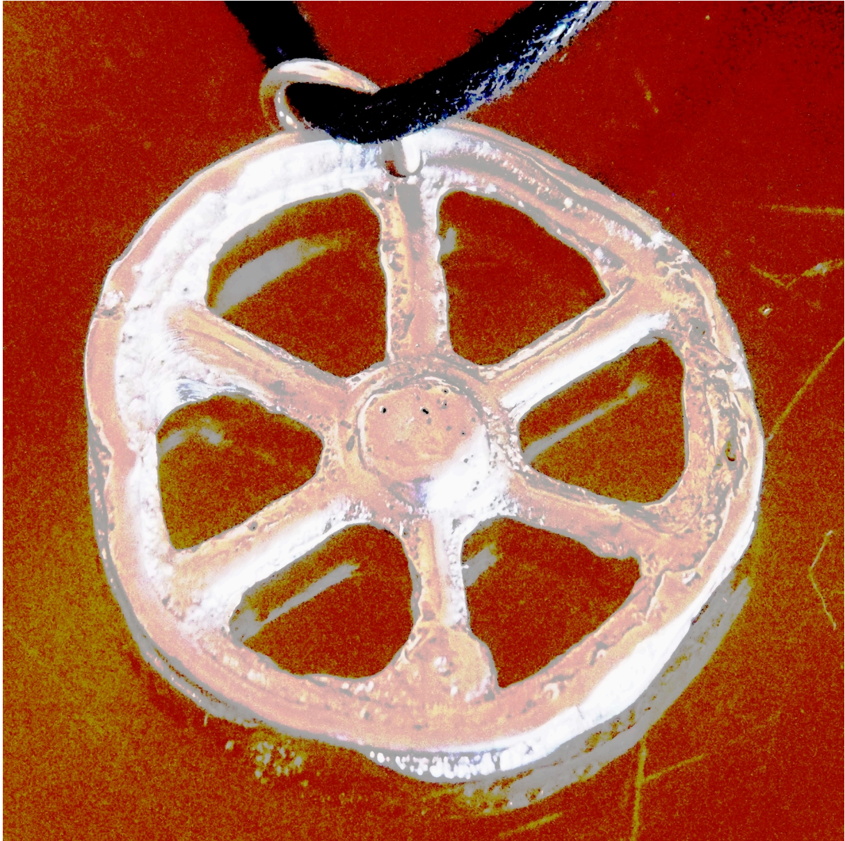
Martin Kesting Jewelry 2023 Sand Casting Sterling Silver

“Intriguing subject with historical interest and, of course, a touch of spirit. ... There is evidence of a connection in the pictures, of connection between the subject with the person behind the camera. ... Your style brings that elegance of mid-20th century documentary photography, without feeling out-of-date at all. ... the deployment of your thoughts and emotions with the poignant and sensitive portrayal of the subject provides a space for viewers to pause and reflect on the past and present.”